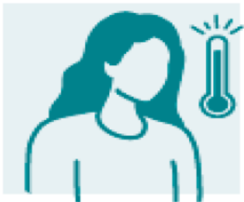
Πυρετός, ρίγη ή ιδρώτας