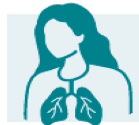
Δυσκολία στην αναπνοή