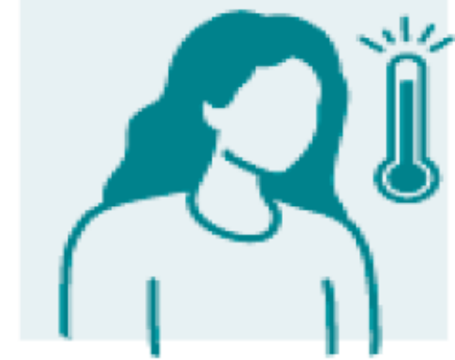
الحمى أو القشعريرة أو التعرق